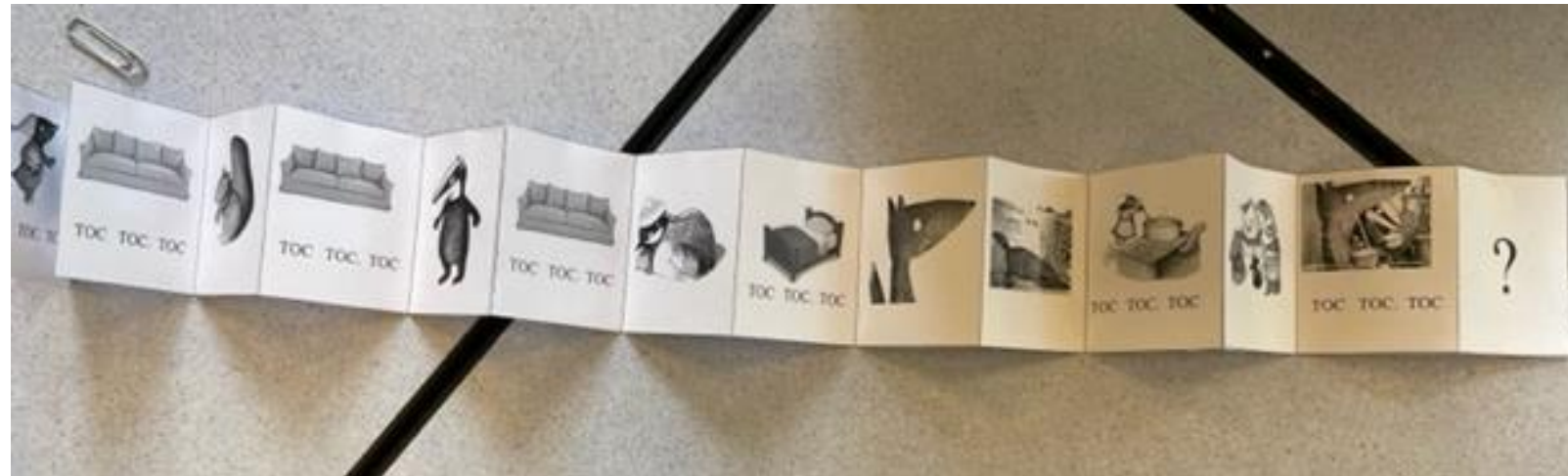
Maternelle Jean d'Ormesson Dépliant transmis aux familles