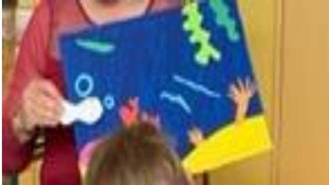
Maternelle Jean d'Ormesson-Allemand Kleiner weisser Fisch

Compréhension de l'écrit et expression orale